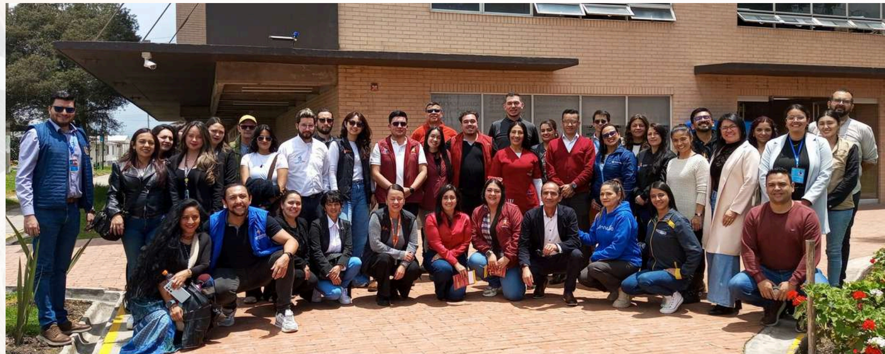
“LA NAVE DE LOS SUEÑOS” Historias rodantes con la escuela Chacua I.D Pablo Neruda Una iniciativa en alianza con la Fundación Bolívar y la Fundación Sanimax.